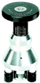
Elcometer 106 Haftfestigkeitsprüfgerät